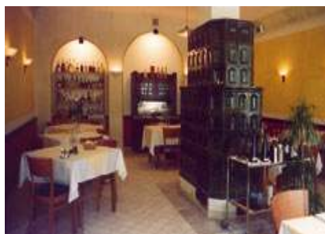
Ristorante il Pettrosso

* Osmiza . Per tradizione secolare era concesso alle aziende agricole del comprensorio, con dispensa imperiale, di aprire al pubblico con la licenza di vendita diretta dei propri prodotti. La prassi odierna prevede che in 3 periodi quindicinali: metà luglio, inizio novembre e metà marzo i vignaioli possano aprire la mescita al pubblico offrendo cibi di territorio in abbinamento.