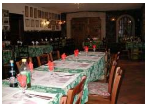
Azienda Vitivinicola Milic